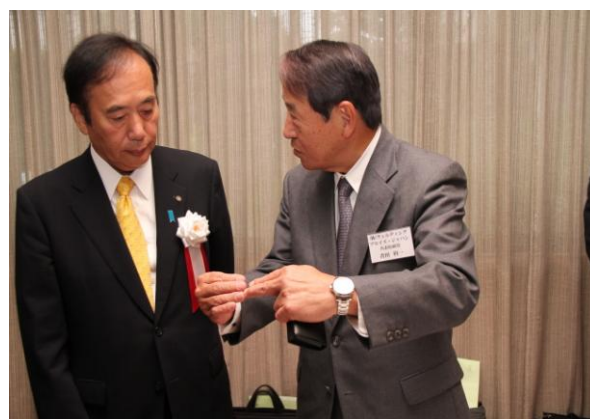
上田埼玉県知事に当社の考え方を説明する青田社長