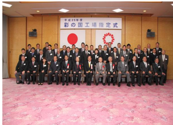
平成25年度「彩の国」に指定された事業所

当社の事業である「肉盛溶接による機器の再生」においては作業環境が劣悪になりがちですが、当社は創業以来この環境改善こそ品質維持に欠かせない要素と考え、生産設備の増強と併せて4Sの励行および設備投資を含めた環境浄化活動を続けて来ました。その結果、当社のような金属加工業には珍しいと言える程の作業環境を維持するまでに至りました。