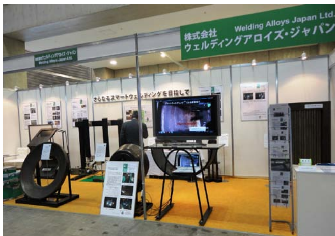
数多くの展示品と技術説明パネルにより主張をさせていただいた 当社のブース