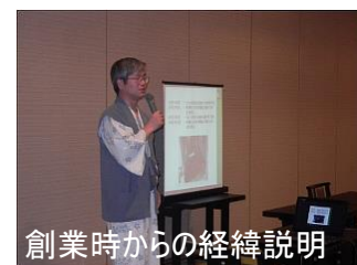
創業時からの経緯説明