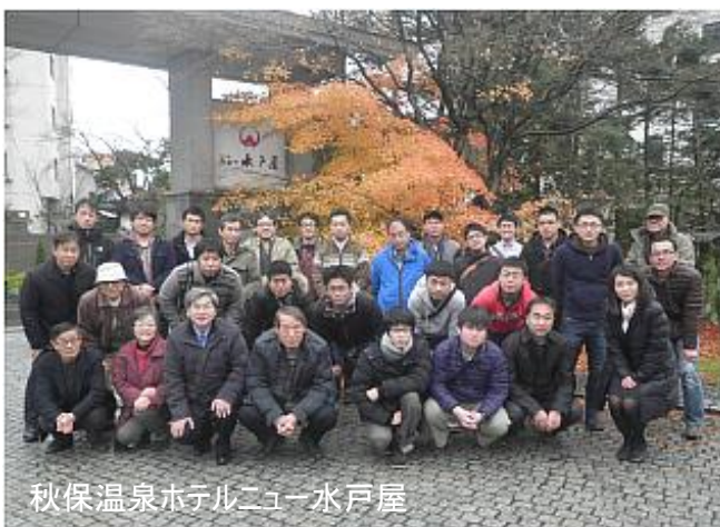
秋保温泉ホテルニュー水戸屋