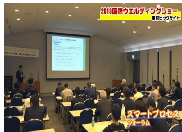
当社による講演状況

「スマートウェルディング™」とは肉盛溶接および前後工程の検査、計測、研削などの要素技術を自動化し、装置から該当部品を分解・移動することなく一連の工程を終了させ、最適な肉盛溶接品質・工期短縮を指向するもので、これこそ時代が求める補修方法であると確信しています。