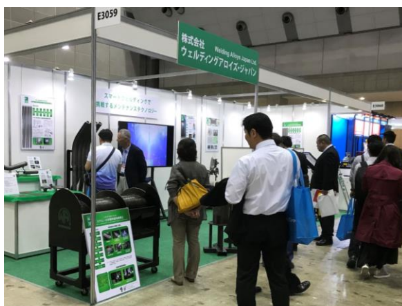
来場者でにぎわう当社ブース

機器の再生・延命事業を展開している当社の使命は肉盛溶接によるメンテナンスを安全・正確に、高い耐摩耗性と耐食性が得られるように施工を行うと共に工期短縮を図ることです。