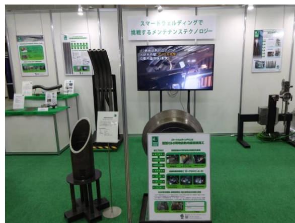
当社ブースの展示状況

当社は創業当初から国際ウェルディングショーの東京開催時に毎回出展し、様々なインフラ機器を自動肉盛溶接技術で再生・延命することにより、お客様にメリットを提供して参りました。今般、「スマートウェルディング™で挑戦するメンテナンステクノロジー」をコンセプトに主に各種ボイラ火炉壁における腐食・侵食など、エネルギーインフラが直面する課題解決に向けた技術提案を展示しました。