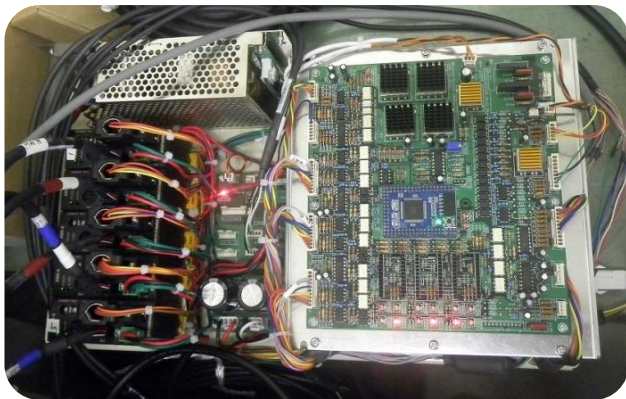
開発した制御装置

当社工場では、小ロットの新品ボイラ火炉壁パネルの製作に対応するため、隅肉溶接装置を開発しました。管の両側の隅肉を同時に溶接するため、溶接後の変形を抑えることができます。