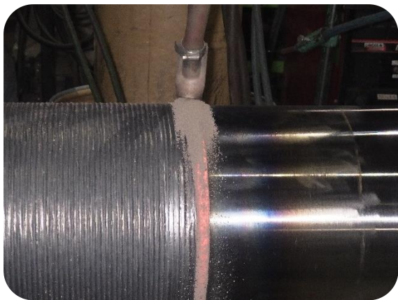
サブマージアーク溶接の外観

各種ロール製品に対し、当社ではサブマージアーク溶接法を採用しております。サブマージアーク溶接は、溶接部をフラックスで覆う溶接法で、ガスシールドアーク溶接と比べて溶接部の品質が良く高能率となる特徴があるため、一部の機械加工仕上げを伴うロール製品の溶接に採用しています。なお、軸の部分補修等も行っています。