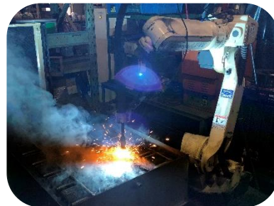
ロボット溶接機の活用