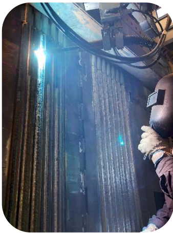
ボイラパネルの新規製作

当工場では、豎型ミルのローラ、テーブルライナ等の再生、ボイラパネルの新規製作、耐摩耗スクリューの再生及び新規製作、その他肉盛プレート等による製缶など耐摩耗・耐食を肉盛溶接で実施しています。自動肉盛溶接を代表とする各種スマートウェルディング®システムを活用し、安全で高品質かつ短納期で施工に取り組んでいます。